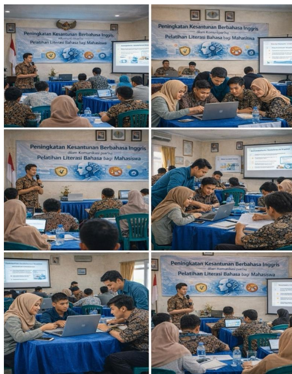
Gambar 4. Kegiatan Pengabdian

Secara keseluruhan, hasil dan analisis pengabdian menunjukkan bahwa kegiatan ini memberikan manfaat nyata bagi peserta dan relevan dengan kebutuhan masyarakat akademik di era digital. Program pengabdian ini dapat dijadikan model atau rujukan untuk kegiatan serupa di masa mendatang, baik dengan sasaran mahasiswa maupun kelompok masyarakat lain yang aktif dalam komunikasi daring menggunakan bahasa Inggris.