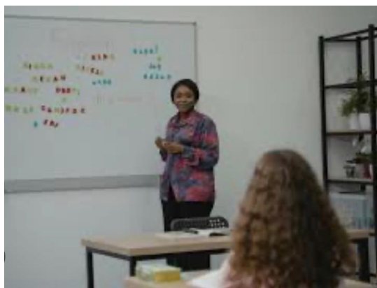
Gambar 2. Metode Pendekatan Edukatif