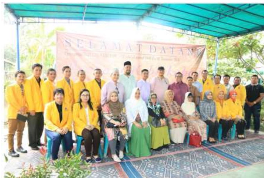
Gambar 3. Kegiatan Pengabdian