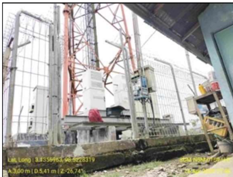
Gambar 1. Infrastruktur TIK

Konsep keberlanjutan TIK sering kali dikaitkan dengan dua istilah utama, yaitu Green Information Technology (Green IT) dan Green Information System (Green IS). Meskipun saling terkait, keduanya memiliki fokus yang berbeda. Green IT berfokus pada aspek teknologi dan infrastruktur TIK yang ramah lingkungan, seperti penggunaan perangkat hemat energi, virtualisasi server, manajemen daya komputer, serta pengelolaan limbah elektronik [10]. Dalam pendidikan, penerapan Green IT dapat berupa penggunaan perangkat berlabel energy star, pengaturan sleep mode komputer laboratorium, serta optimalisasi penggunaan server sekolah.