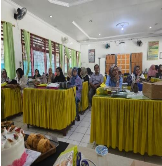
Gambar 3. Audiens

Tim pengabdian masyarakat bersama dengan tim komunitas Persati Beken menjalin kerjasama dalam hal pemberian edukasi dan sosialisasi tentang peran sertifikasi halal pada sektor pariwisata dan pelaku usaha kuliner makanan binaan Komunitas Persati Beken