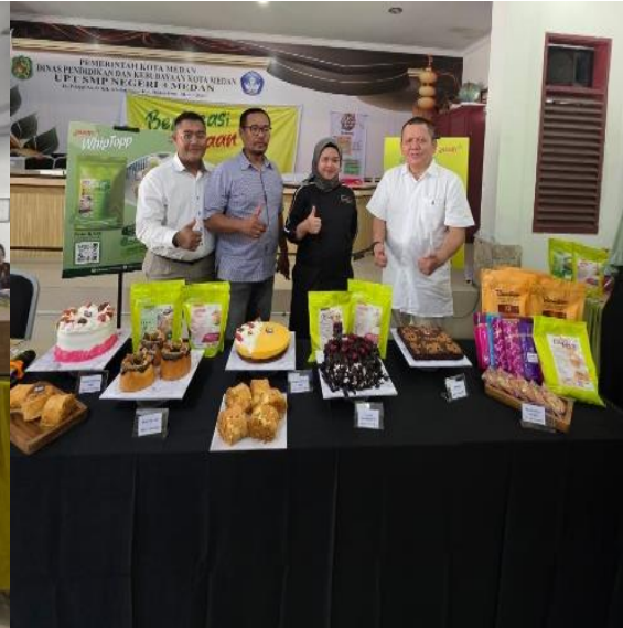
Gambar. 4 Produk Kuliner Makanan

Seluruh peserta yang hadir pada kegiatan sangat merespon positif dengan dilakukannya kegiatan tersebut, dimana seluruh peserta antusias mendengarkan dan menyimak serta memahami penyampaian materi edukasi sertifikasi halal produk yang disampaikan oleh tim pengabdian. Peserta juga menanggapi kegiatan ini untuk dilakukan secara kontinuitas agar pelaku usaha bisa didampingi untuk pengurusan sertifikasi halal produknya. Kegiatan pengabdian masyarakat ini sangat didukung dengan kegiatan kegiatan pengabdian masyarakat sebelumnya yang dilakukan oleh tim pengabdian lainnya yaitu [7] hasil dari pengabdian masyarakatnya menunjukkan bahwa sebanyak 34 pelaku usaha UMKM Kecamatan Burneh Bangkalan didampingi dalam proses pengurusan sertifikasi halal produk oleh tim pengabdian.