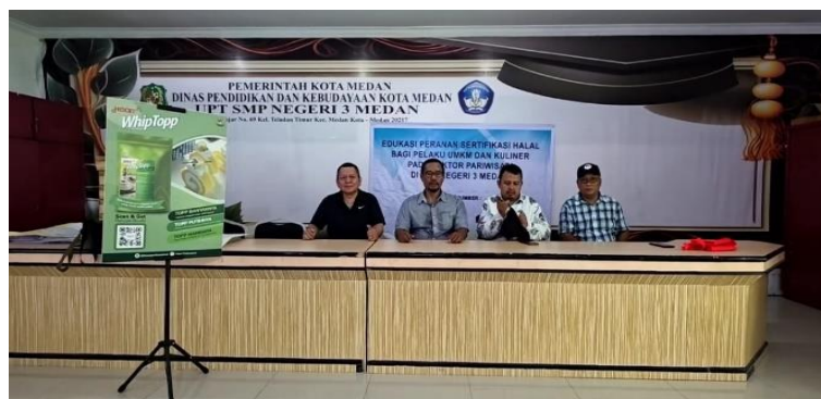
Gambar 2. Tim Pengabdian Masyarakat Bersama dengan Tim Komunitas Persati Beken

Hasil dari kegiatan pengabdian masyarakat yang dilaksanakan pada pelaku usaha kuliner makanan dan sektor pariwisata di SMP Negeri 3 Medan sebagai berikut :